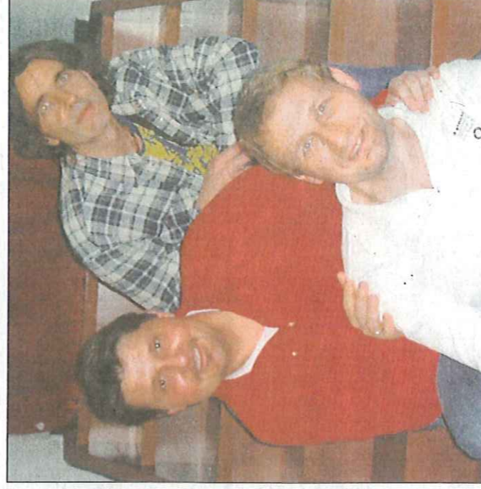
Der Vereinsvorstand von Schurwald rockt ist bereits mit den Jahresplanungen beschäftigt und freut sich auf Mitstreiter.