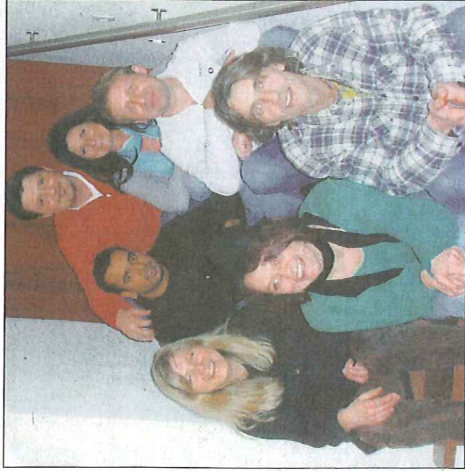
Diese sieben Kulturaktivisten gründeten den Verein Schurwald rockt. Sie sind sicher, dass ihr hoffnungsvolles Projekt Kreise ziehen wird.